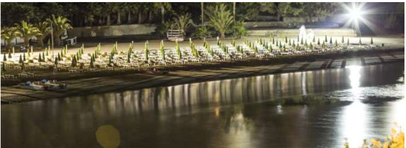
Evento formativo residenziale "GATTARELLA 2017" Vieste (Foggia) - 10 11 12 Settembre 2017